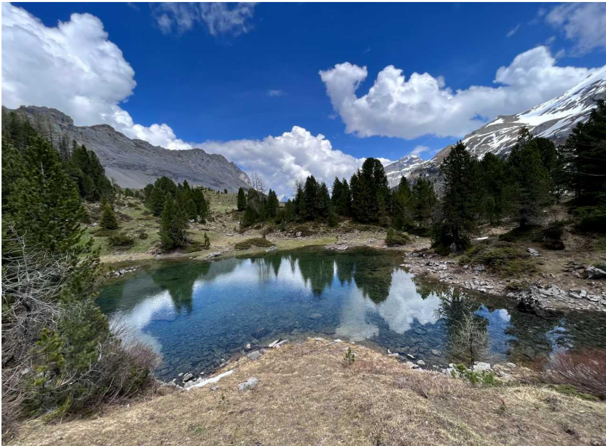
Arvenseeli bei der Alp Splittelmatte Kandersteg

Als krönenden Abschluss gönne ich mir einen Emmentaler Meringues, der meine Geschmackssinne verführt. Umgeben von den majestätischen Bergen und der herzlichen Gastfreundschaft fühle ich mich in diesem Moment glücklich und zufrieden, als Teil dieser wunderbaren Naturlandschaft.