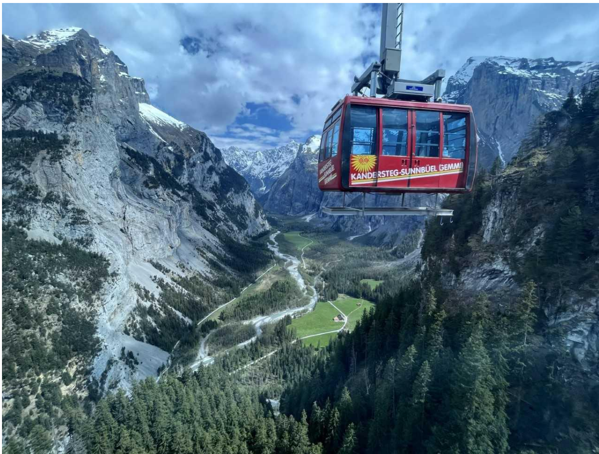
Luftseilbahn Kandersteg-Sunnbüel Sunnbüel

Müelos schwebe ich mit der Luftseilbahn hinauf zur Bergstation Sunnbüel. Von dort aus starte ich zu einer etwa einstündigen Wanderung zu der Alp Splittelmatten inmitten von majestätischen Gipfeln und zu dem verträumten Arvensee , deren glitzernde Oberfläche im Morgenlicht einen bezaubernden Anblick bietet.